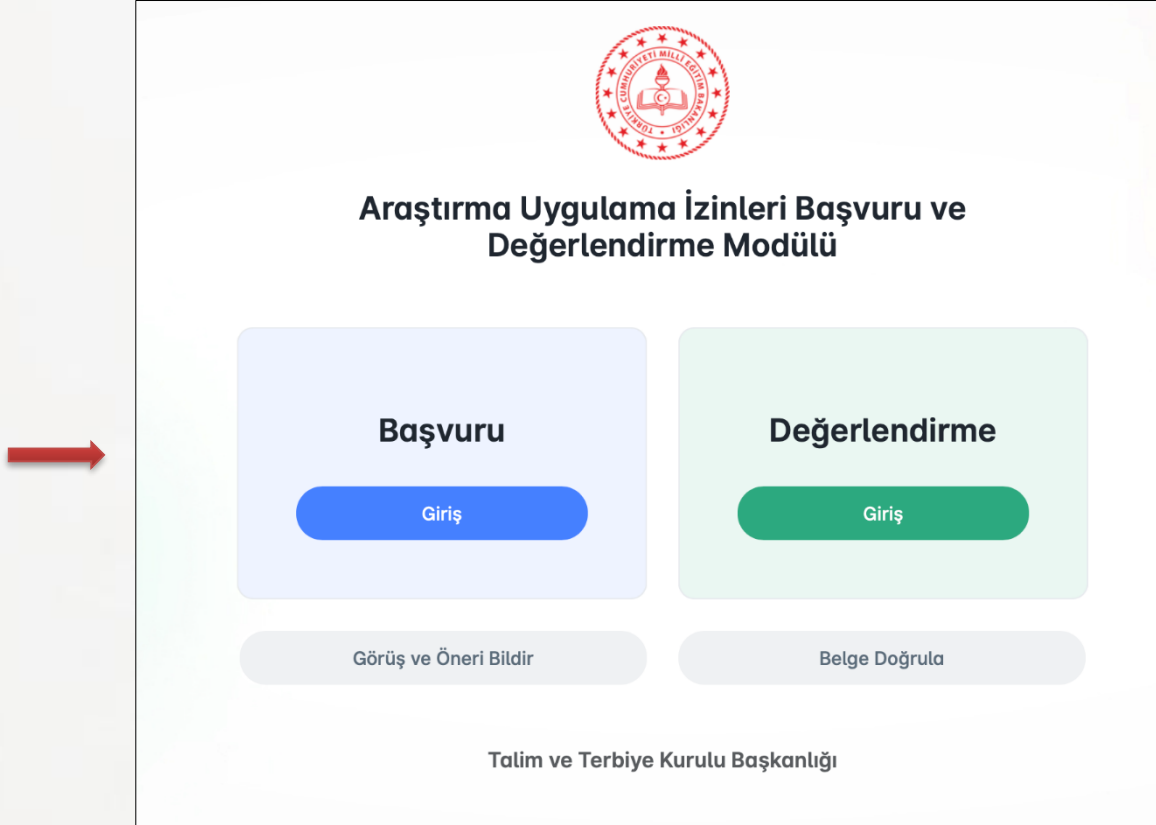
řekil 1: https://arastirmaizinleri.meb.gov.tr ana sayfa