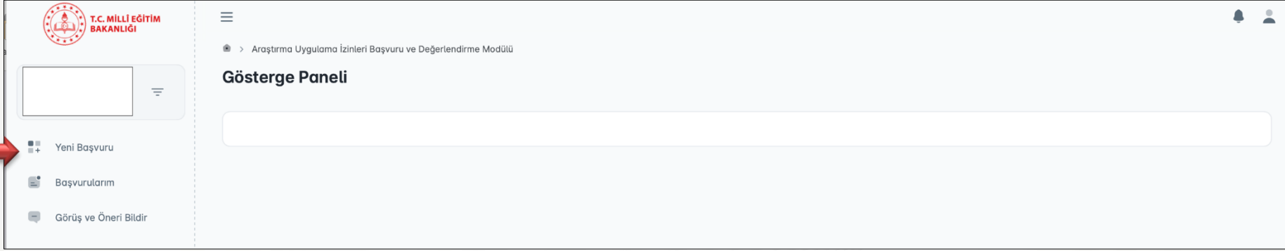
Şekil 4: https://arastirmaizinleri.meb.gov.tr sayfası > Yeni Bařvuru